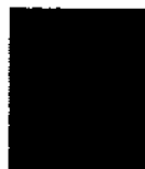
נ.צ.מ. דורית זינגר

ניתן היום, ט"ו שבט תשע"ט, (21 ינואר 2019), בהעדר הצדדים ויישלח אליהם.